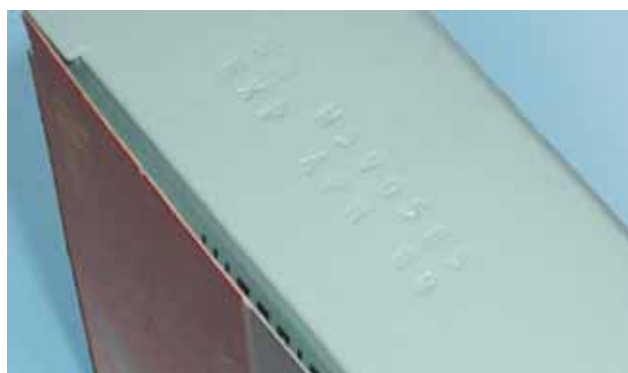
Impressão em baixo relevo: dados fixos e pouco contraste