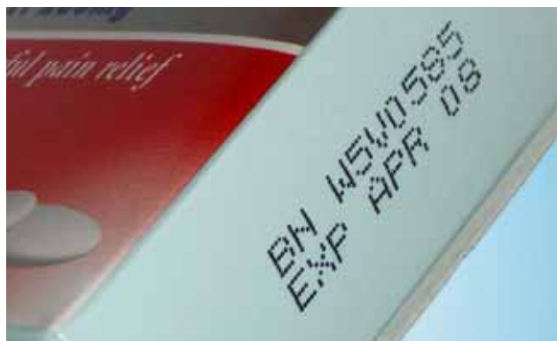
Videojet 1120: códigos variáveis e alto contraste