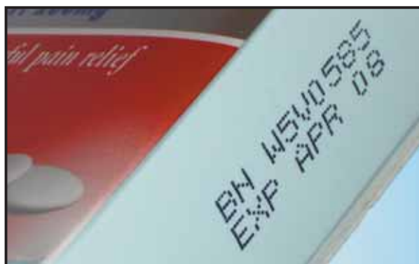
Videojet 1120: códigos variáveis e alto contraste