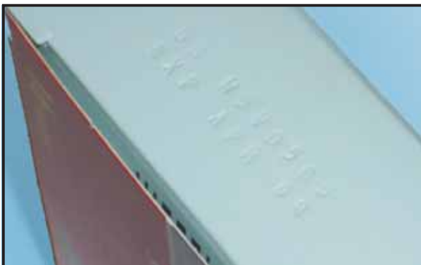
Impressão em baixo relevo: dados fixos e poucos contrastante